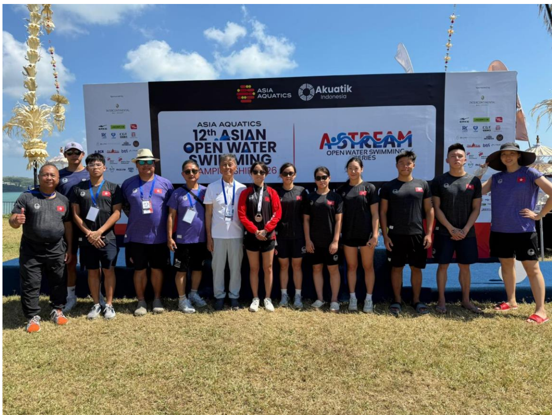
中國香港公開水域游泳代表隊合照。